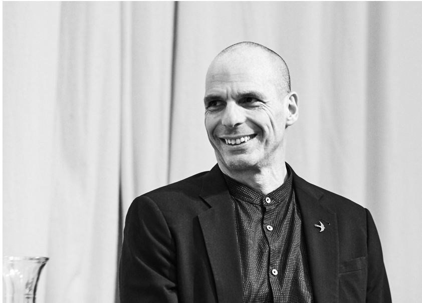
Abb. 1: Yanis Varoufakis