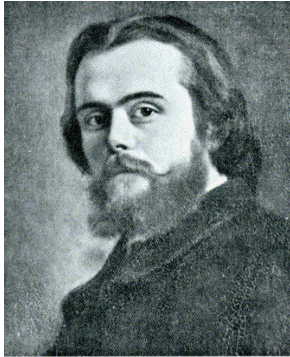
Abb. 3: Léon Walras

zu beschreiben. Vielmehr entsprach das Allgemeine Gleichgewichtsmodell seiner Vorstellung einer idealen Gesellschaft.